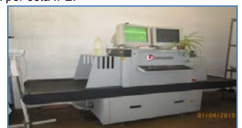
Mantenimiento de Equipos de Seguridad. Muestra Equipo de control de Bultos. (Rayos X)