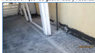
Mantenimiento de Cubiertas, sector losa 2º piso, Antimitón. Reposición de Carpeta asfáltica.

Mantenimiento instalaciones sanitarias exteriores: Se instaló nuevo remarcador electromagnético en el acceso vehicular al EP, esto con el fin de tener un control para revisar posibles fugas de agua en la zona externa del Establecimiento Penitenciario, instalación que fue gestionada y fiscalizada por esta IFE.