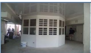
Sector de Guardia de Módulo Agrupación 47-50

Edificio de estadísticas y sala eléctrica N°2: Durante abril se ha estado realizando seguimientos a estos edificios pues presentan daños en sus instalaciones, tales como, fisuras en muros y grietas en los pavimentos colindantes, producto de socavamientos encontrados bajo la losa. Se le ha otorgado a la S.C. plazo hasta el día 11 de mayo para hacer entrega de los antecedentes solicitado en instrucción en el Libro de Explotación páginas 532 y 533.