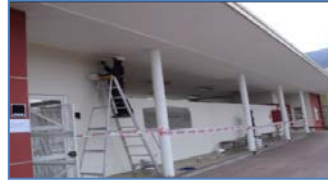
Plan de Pintura 2015

Inspección Obras de Densificación – Acondicionamiento de Central de Alimentación Interna: Durante la semana de 06/04/15 al 10/04/15, se realizó inspección de las instalaciones e infraestructura ejecutada en la Central de Alimentación Interna (CAI), para recepción y puesta en servicio.