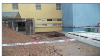
Trabajos prospecciones, A-11, Edificio de Guardia Interna.