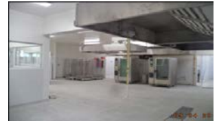
Fiscalización Programa de Densificación, sector Central de Alimentación Interna (CAI)